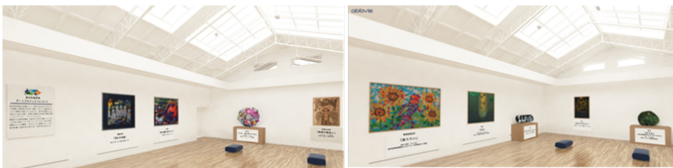
「オンライン美術館」のイメージ

※本「オンライン美術館」は 2022 年 6 月 30 日(木)をもって公開を終了いたしました。多くの方にご訪問をいただきありがとうございました。なお、第 3 回 PERSPECTIVES 受賞作品は アッヴィのホームページ でご覧いただけます。(2022 年 7 月 4 日更新)